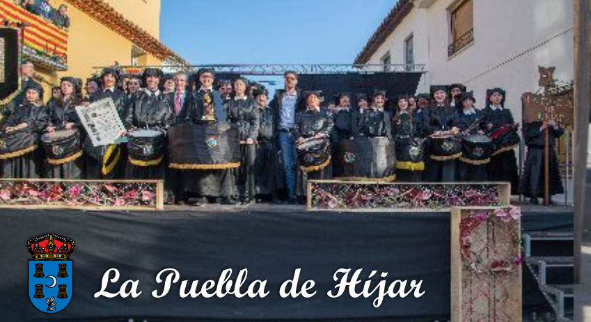
La Puebla de Híjar