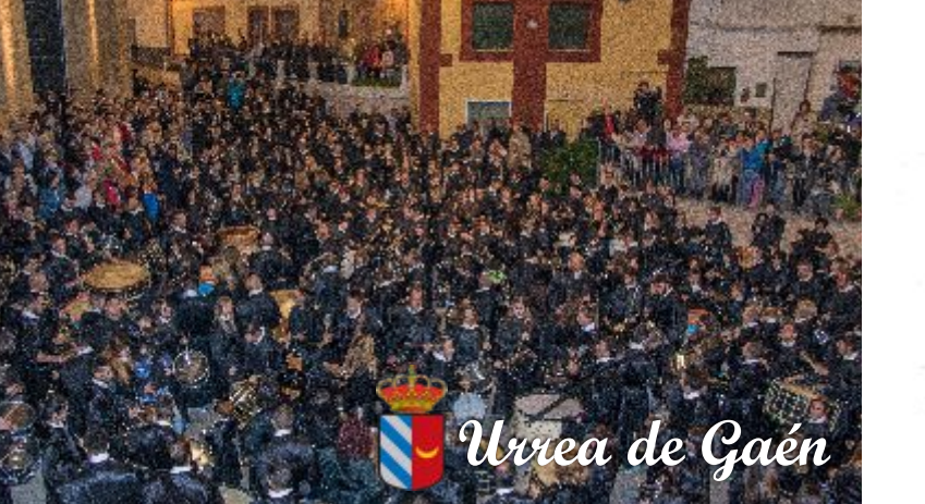
Urrea de Gaén