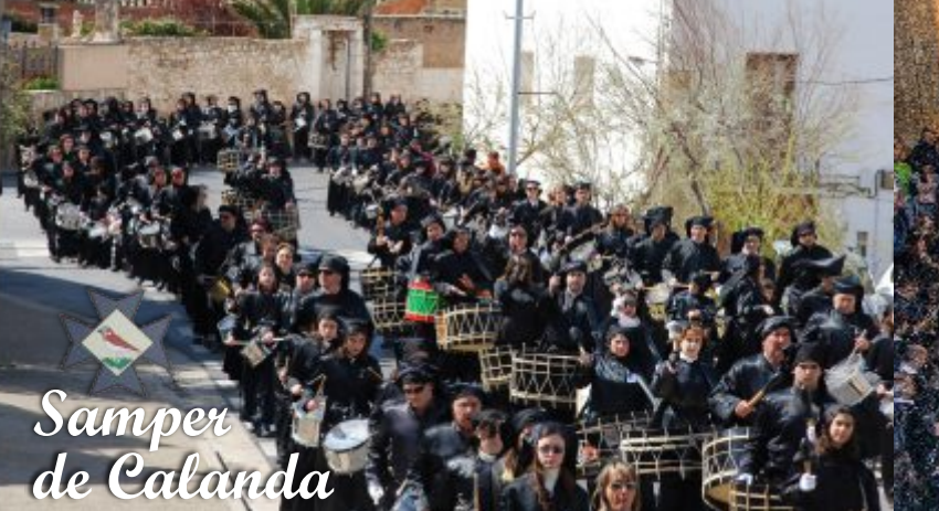
Samper de Calanda