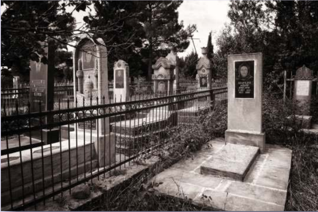
Shamakhi, cementerio moderno (II)