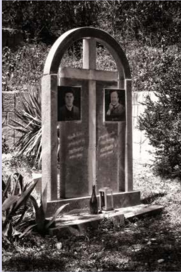
Ofrendas y recuerdos en este humilde cementerio rural