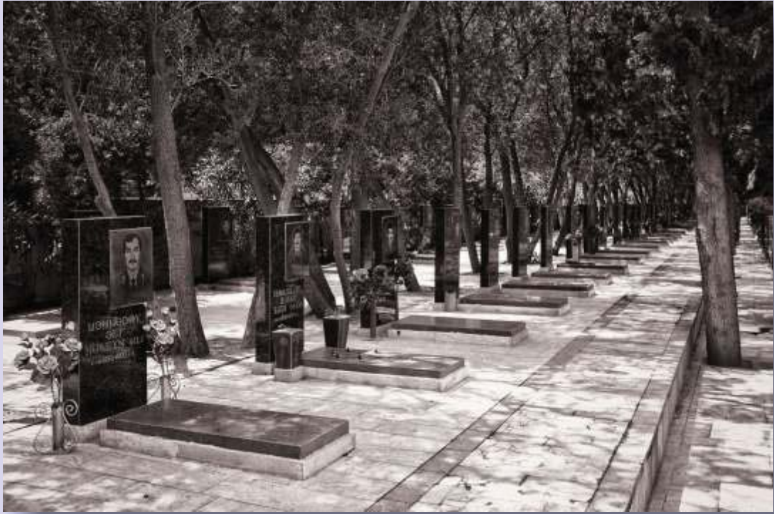
La avenida de los Mártires, en Bakú