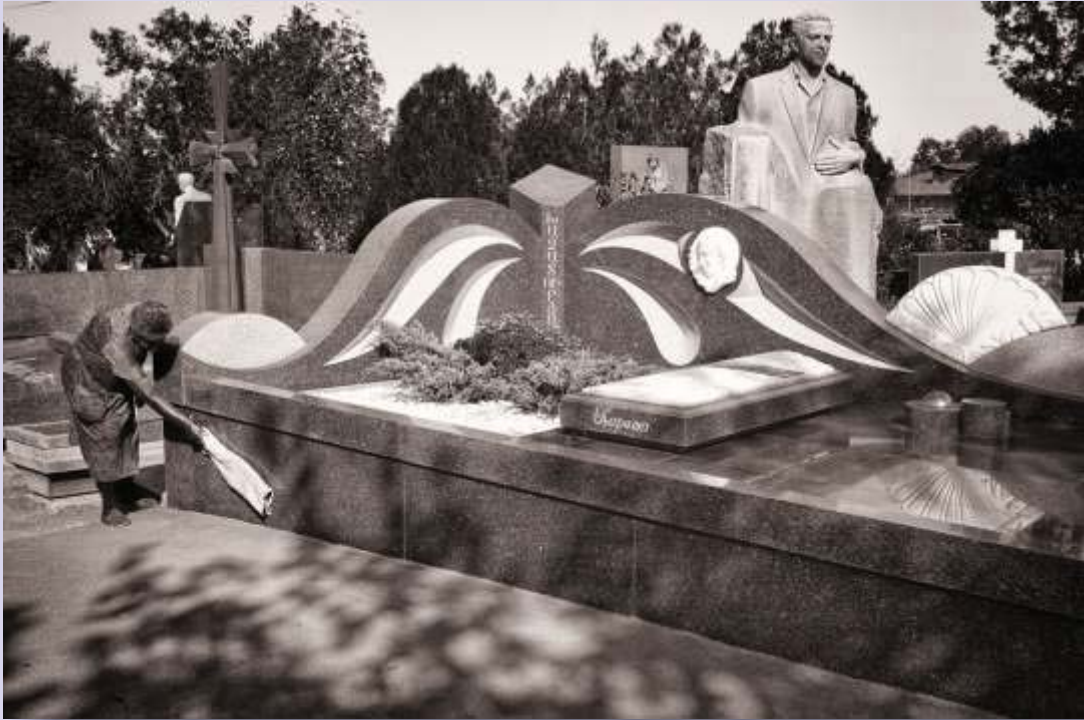
Limpieza de un mausoleo en un cementerio de Ereván, la capital