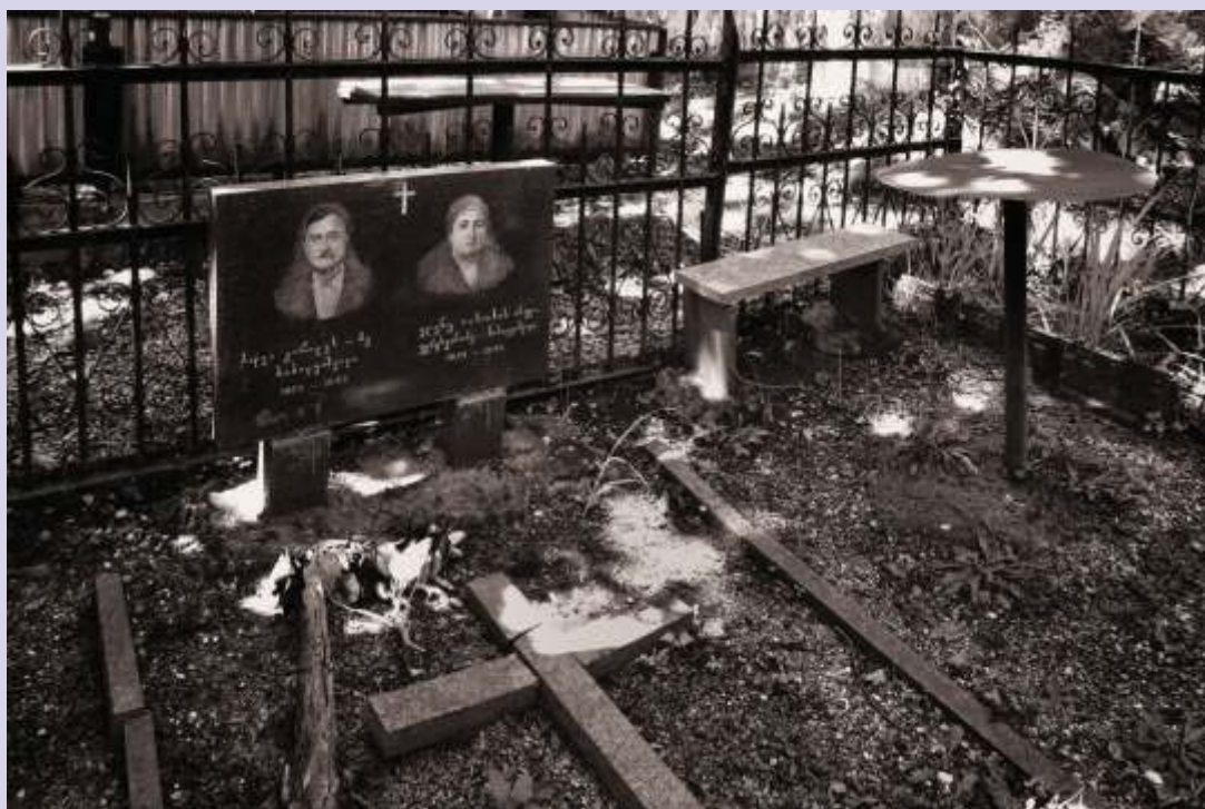
Otra parcela para reuniones con los antepasados