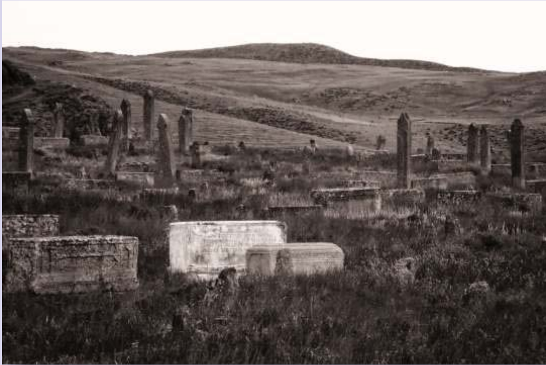
© Joaquín Conde Antiguo cementerio musulmán de Gobustan