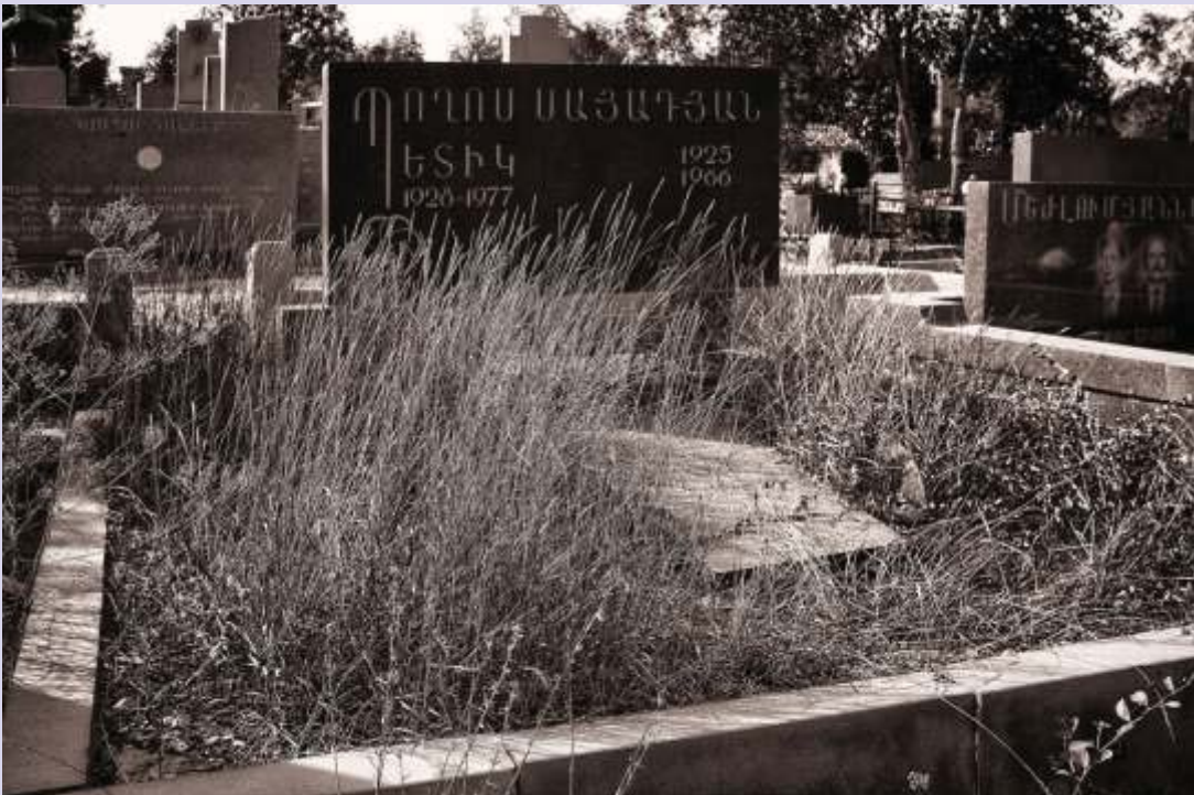
Panteón descuidado. Escena poco frecuente en un pueblo que mima su pasado