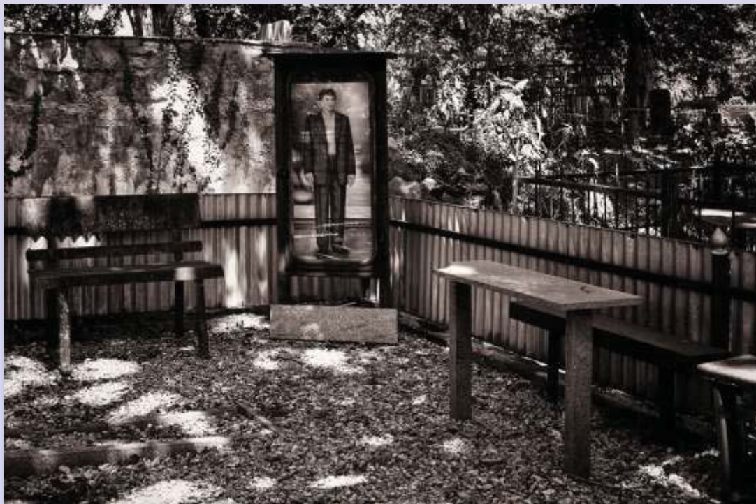
© Joaquín Conde Espacio familiar en un cementerio junto al monasterio de Motsameta