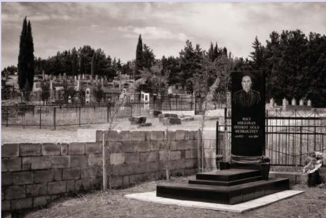
© Joaquín Conde Shamakhi, cementerio moderno (I)