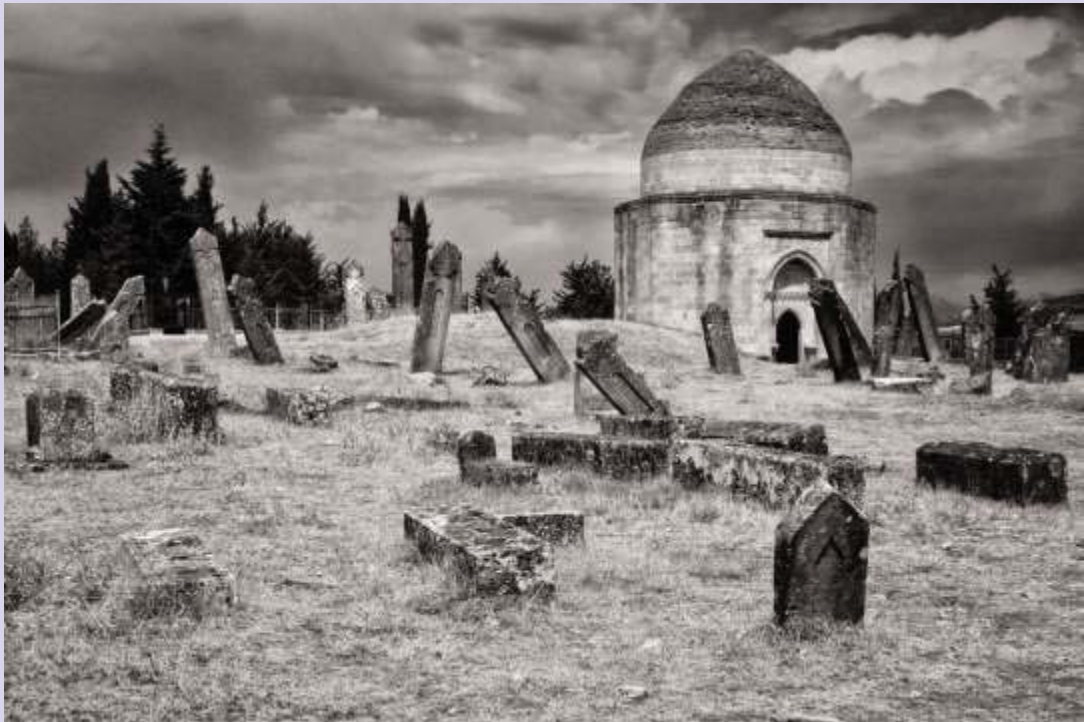
© Joaquín Conde Mausoleo de Yeddi Gumbes, las siete cúpulas