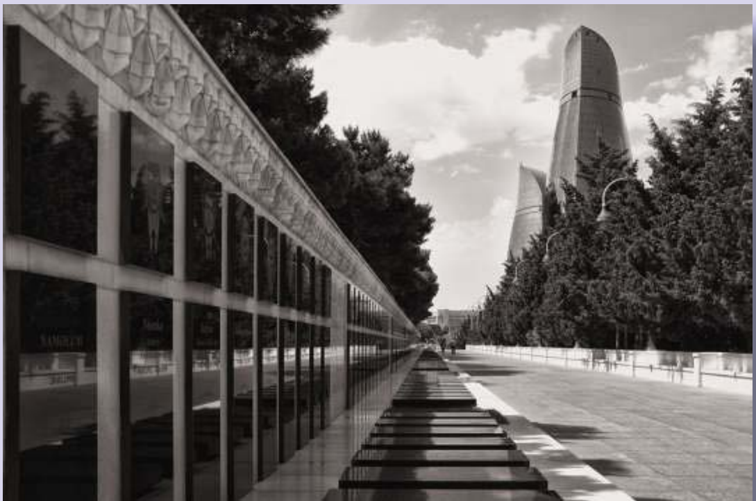
© Joaquín Conde Parque Kirov (Bakú) al pie de las Torres del Fuego